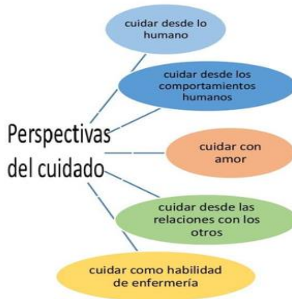
Fig. 2: Perspectivas del Cuidado