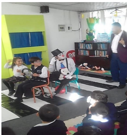
Fig.3. Ubicación correcta en el vehículo.