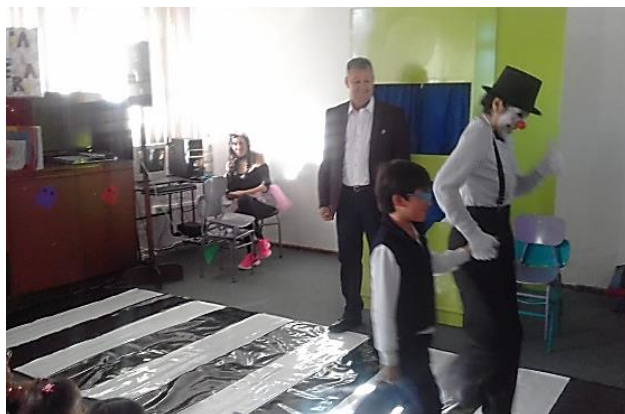
Fig.2. Mimo, uso del paso cebra.

El objetivo de utilizar al mimo y el payaso en la enseñanza - aprendizaje, procura que el niño o la niña logren una conciencia de sí mismos como sujetos capaces de evocar el respeto por las señales de tránsito y a los usuarios de las vías; así como el desarrollo de la capacidad crítica y reflexiva en las diversas situaciones del tránsito.