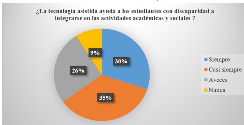
Figura 2. ¿La tecnología asistida ayuda a los estudiantes con discapacidad a integrarse en las actividades académicas y sociales?

Nota: Información obtenida de (Morales, 2021).