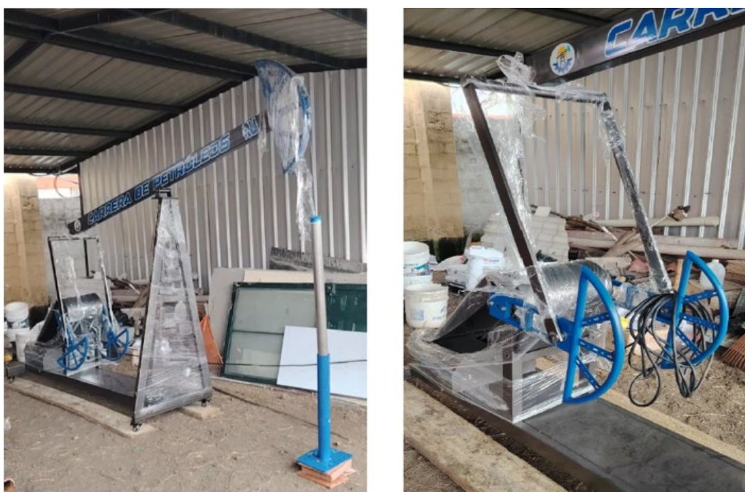
Figura 3. Prototipo de balancín terminado