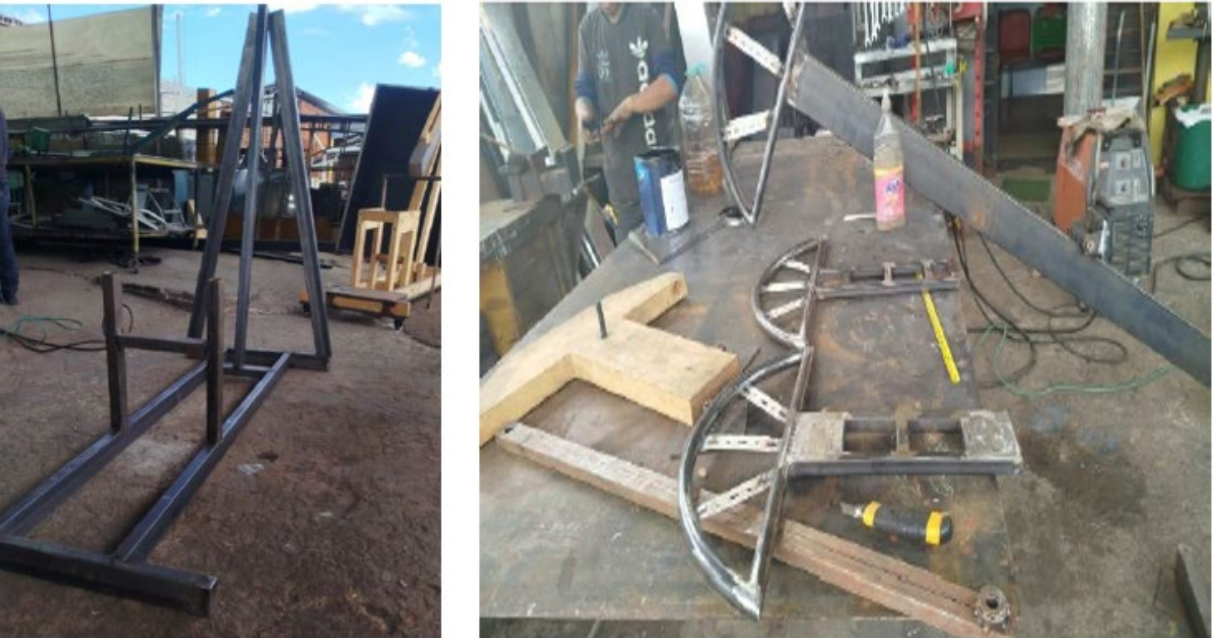
Figura 2. Montaje del balancín

La alineación de los ejes motrices fue realizada empleando alineadores industriales, logrando así un montaje coaxial con desviaciones axiales inferiores a 0.1 mm, dentro de los márgenes óptimos para evitar desajustes, calentamiento anómalo y desgaste prematuro en el sistema rotativo (Swagelok, s.f.)