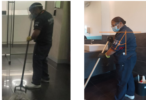
Figura 1. (A) Trapeando, (B) Barriendo.