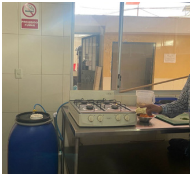
Figura 4. Presentación producción biogás

Nota: Durante 4 meses se degradó los residuos orgánicos, demostración del funcionamiento.