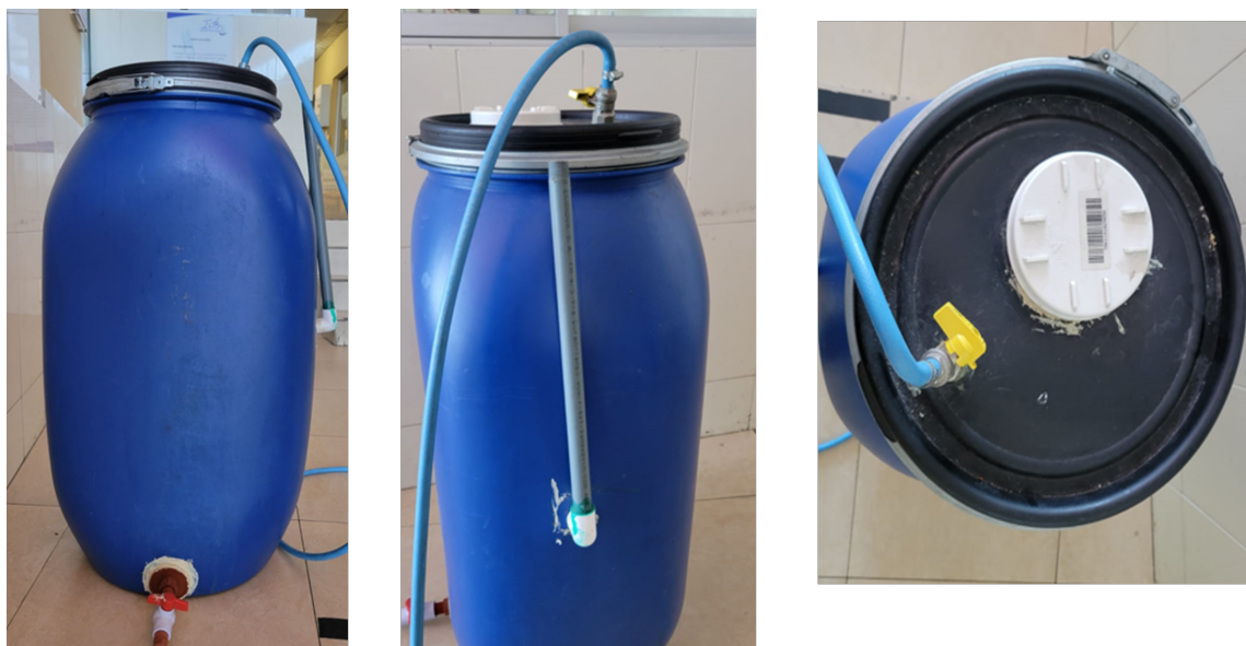
Figura 1. Prototipo biodigestor

El sistema de captura de biogás es otro componente crucial del biodigestor, diseñado para recoger y almacenar el biogás generado. Este gas está compuesto principalmente de metano ( \text{CH}_4 ) y dióxido de carbono ( \text{CO}_2 ), y su captura efectiva es fundamental para su uso posterior como fuente de energía (Zhao et al. , 2020). La salida de gas permite la utilización práctica del biogás, como en las prácticas de cocina mencionadas en el estudio, donde los estudiantes pudieron utilizar el gas producido para cocinar, demostrando su aplicabilidad en un entorno real (Martinez et al. , 2021).