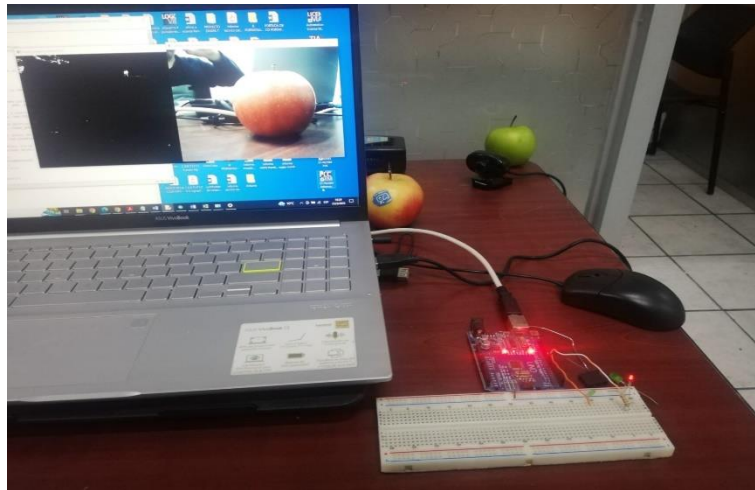
Figura 5. Prototipo completo funcionando: con producto de diferente color.

Prototipo con todos los elementos funcionando, en el presente estudio la acción del controlador es la emisión de una señal luminosa, pero puede configurarse para que se realice otras acciones como, por ejemplo: activación de brazos robóticos, apertura de puertas para productos de desecho, activación de alarmas sonoras, etc.