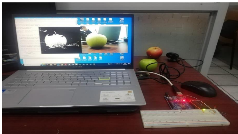
Figura 4. Prototipo completo funcionando, control de calidad basado en el parámetro color (verde).

La realización de pruebas con un prototipo de un sistema de visión artificial es necesario antes de implementar en un proceso de fabricación y/o producción, a fin de ajustar las variables requeridas dentro del rango deseado, asimismo para determinar costos.